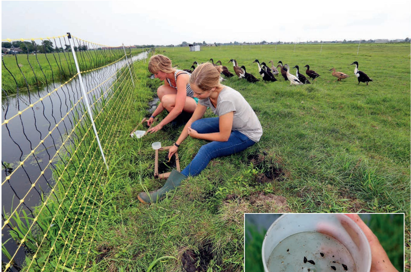
In poeltjes langs de sloot zoeken de studenten leverbotslakjes