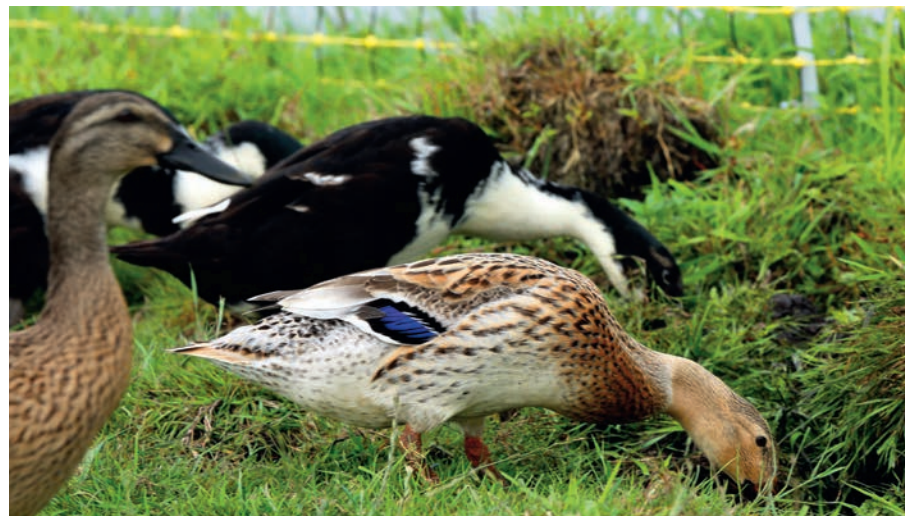
De eenden vreten slakjes

niet gebeurt? “Ik zie niet direct dat elke boer honderd van die loopeenden gaat houden, al zou dat op sommige bedrijven best kunnen. Als je ziet dat je koeien doodgaan aan leverbot en je kunt ze red- den met eenden dan zou dat wel wat zijn.” <<